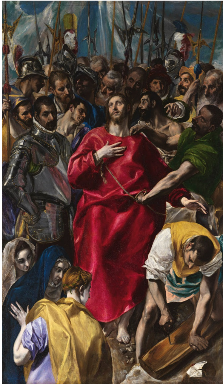
Le Dépeillement du Christ (« El Expolio ») - Le Greco (1577-1579)