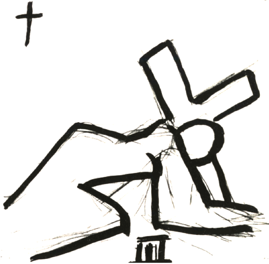
Henri Matisse - Étude pour la Chapelle du Rosaire, Saint-Paul-de-Vence