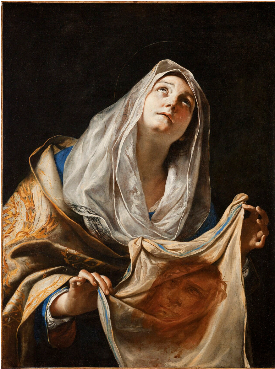
Mattia Preti - Sainte Véronique au voile (vers 1655-1660), musée d'Art du comté de Los Angeles