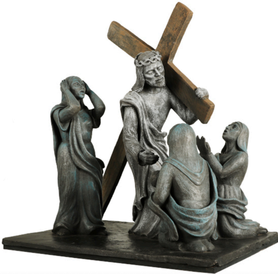
Liliane Caumont - Cathédrale de Metz - Grès patiné