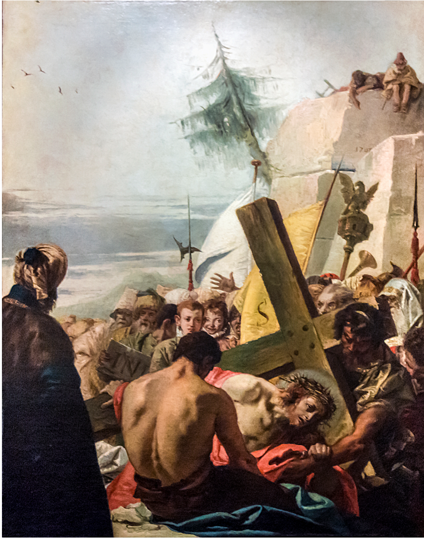
Johann Friedrich Overbeck (1789-1869) - Via Crucis