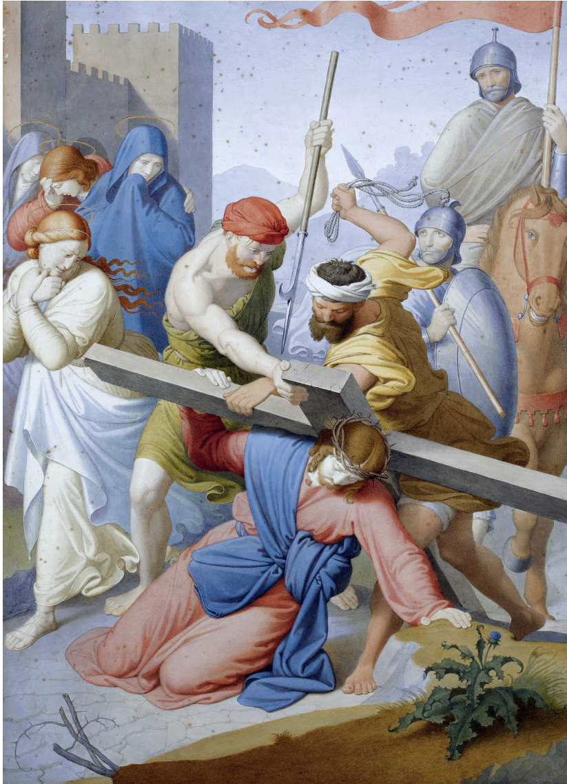
Johann Friedrich Overbeck (1789-1869) - Via Crucis