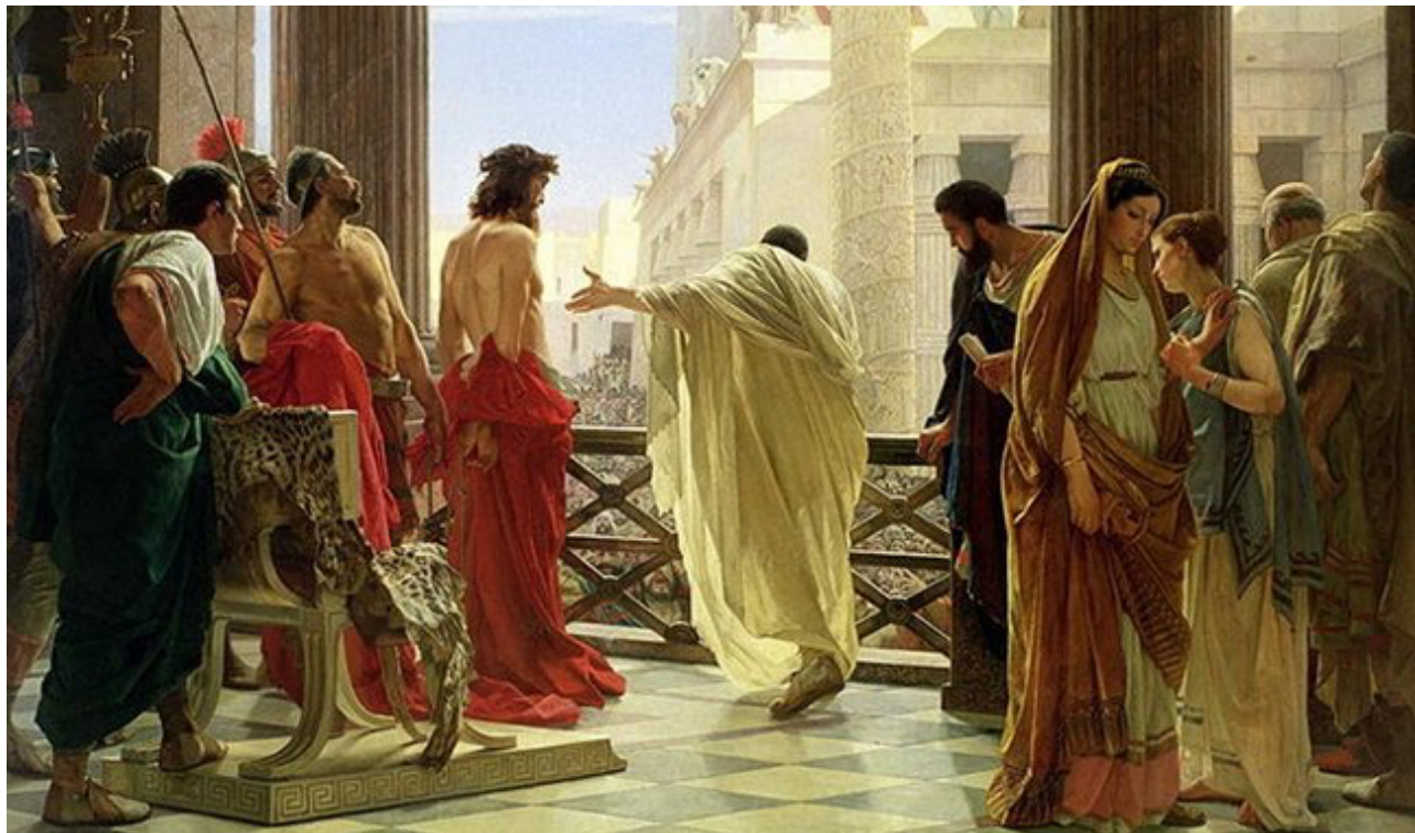
Ecce Homo, par Antonio Ciseri, 1862, Palais Pitti, Galleria d'Arte Moderna, Florence