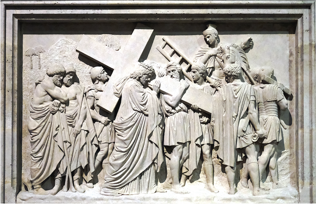
Basilique Sainte-Clotilde de Paris